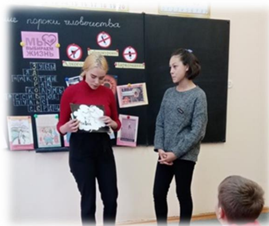
Волонтеры школы выступают перед учащимися начальных классов

“Доброта есть вечная высшая цель нашей жизни”