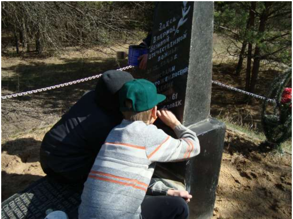
Деревня Возраждение. Работы на братской могиле.