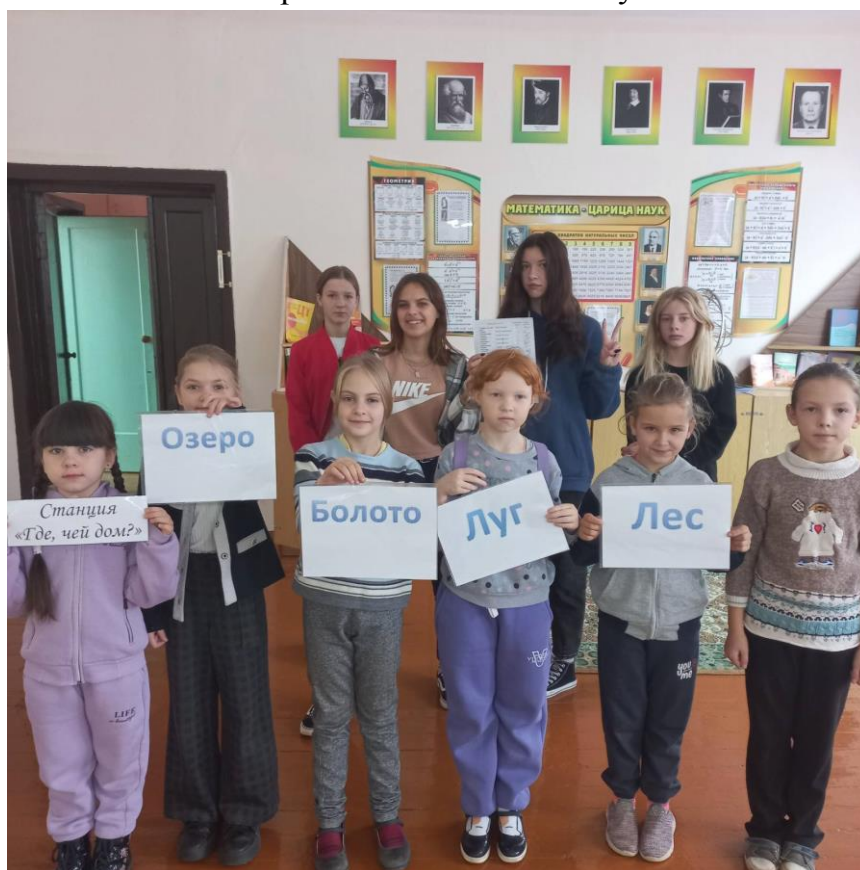
Экологический квест «Природа родного края»