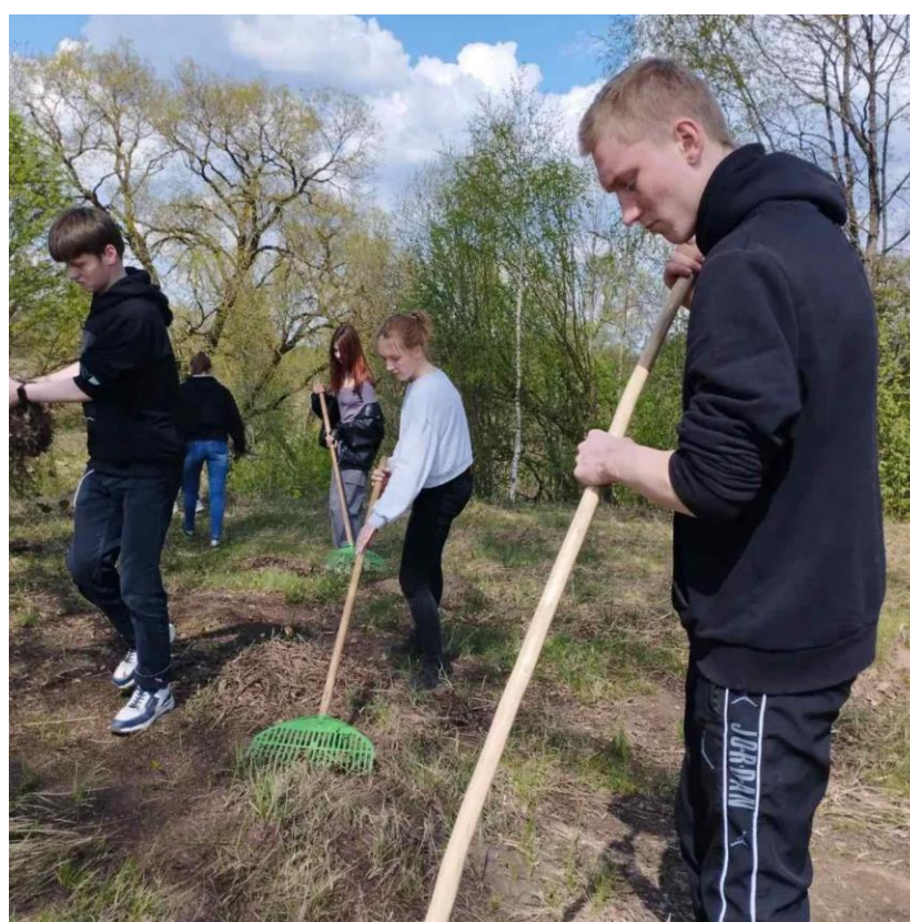
Экологическая акция «Зелёная планета»