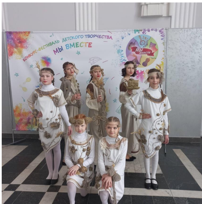
Флористический театр мод в районном проекте «Мы вместе!»