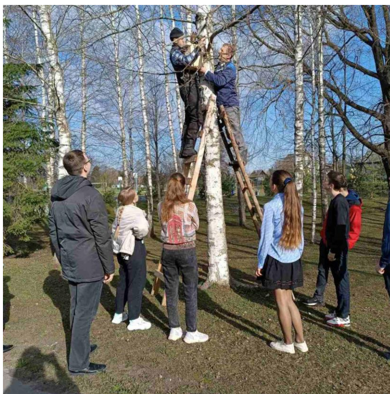
КТД «Птичий домик»