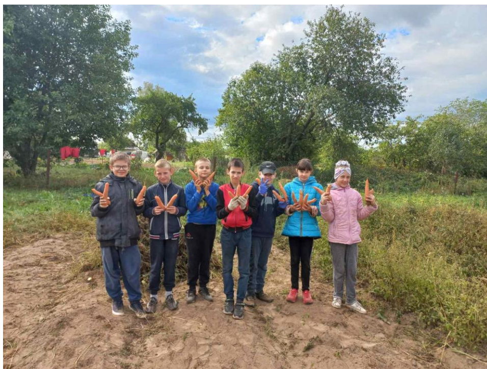
Урожай на славу. Суббота добрых дел