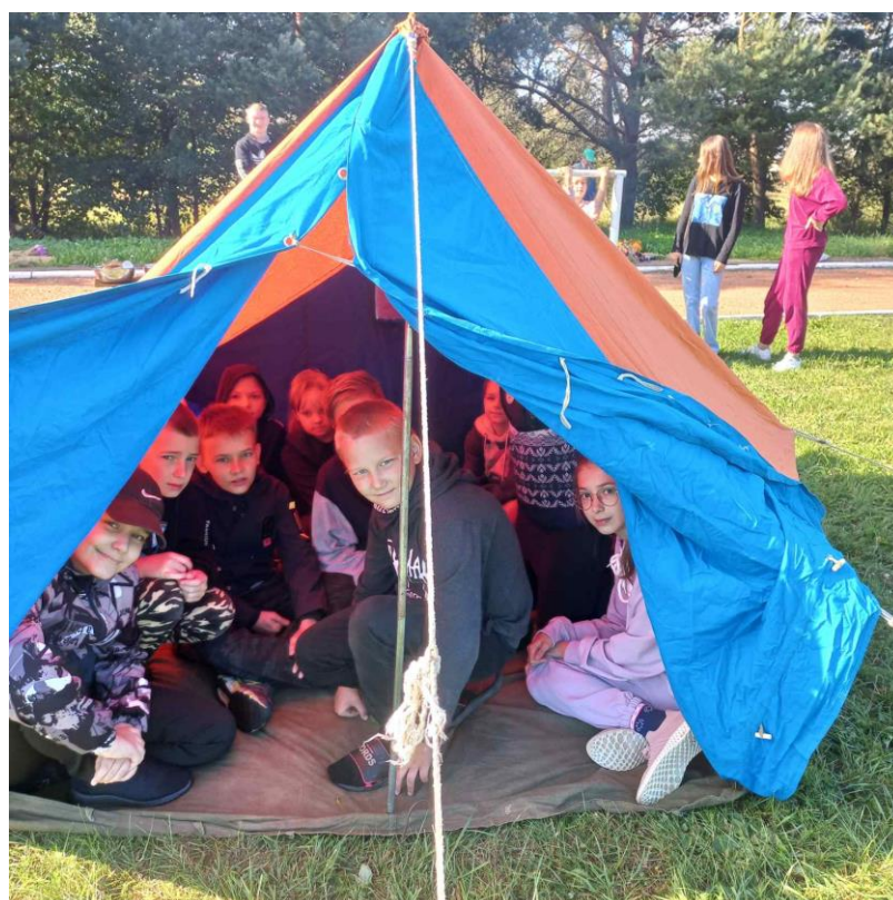
Субботняя школа Выживания