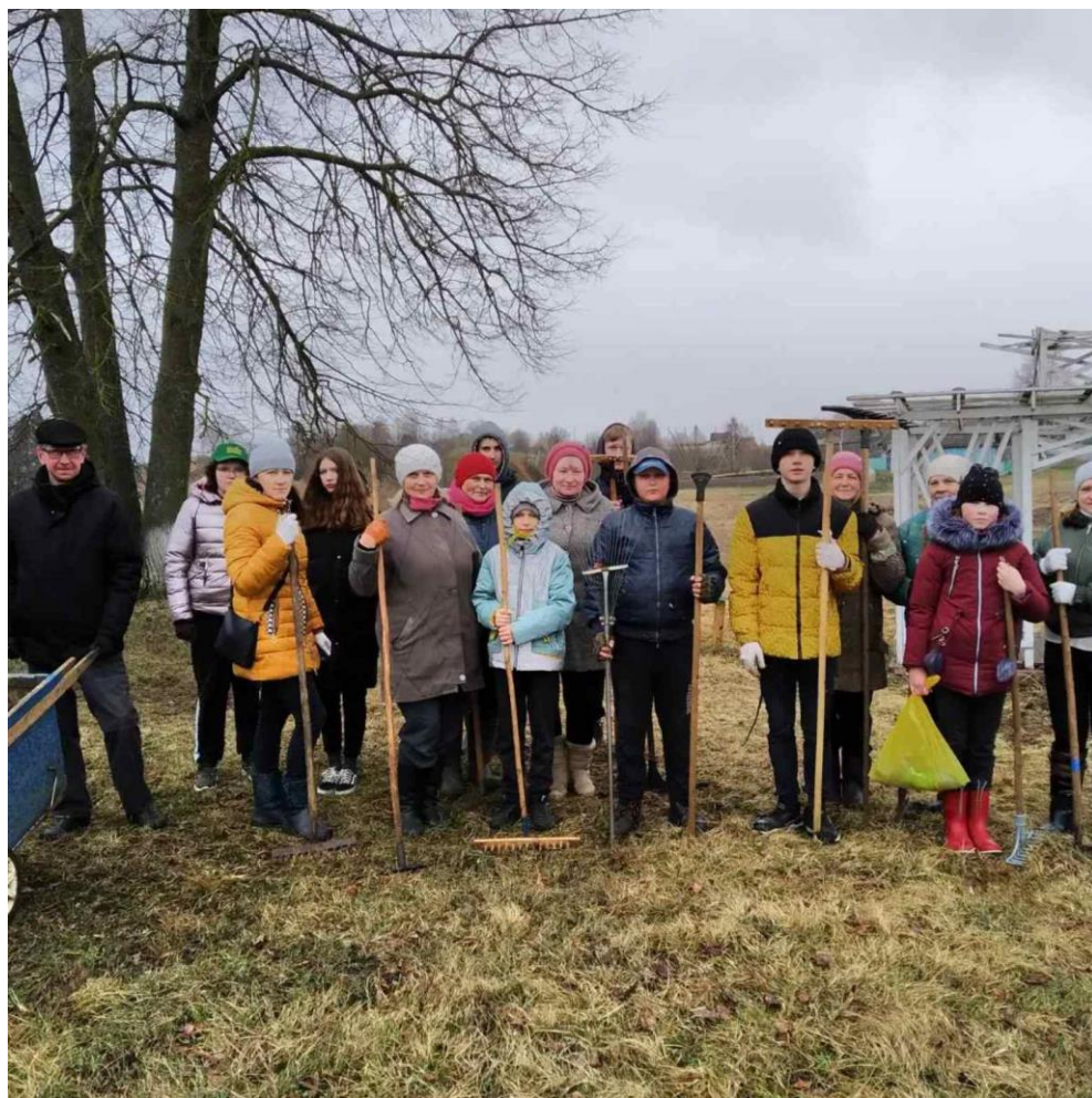
Операция «Чистые Яновичи»