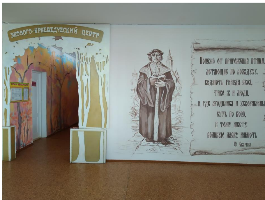
Вход в школьный эколого-краеведческий центр «Яновичане»