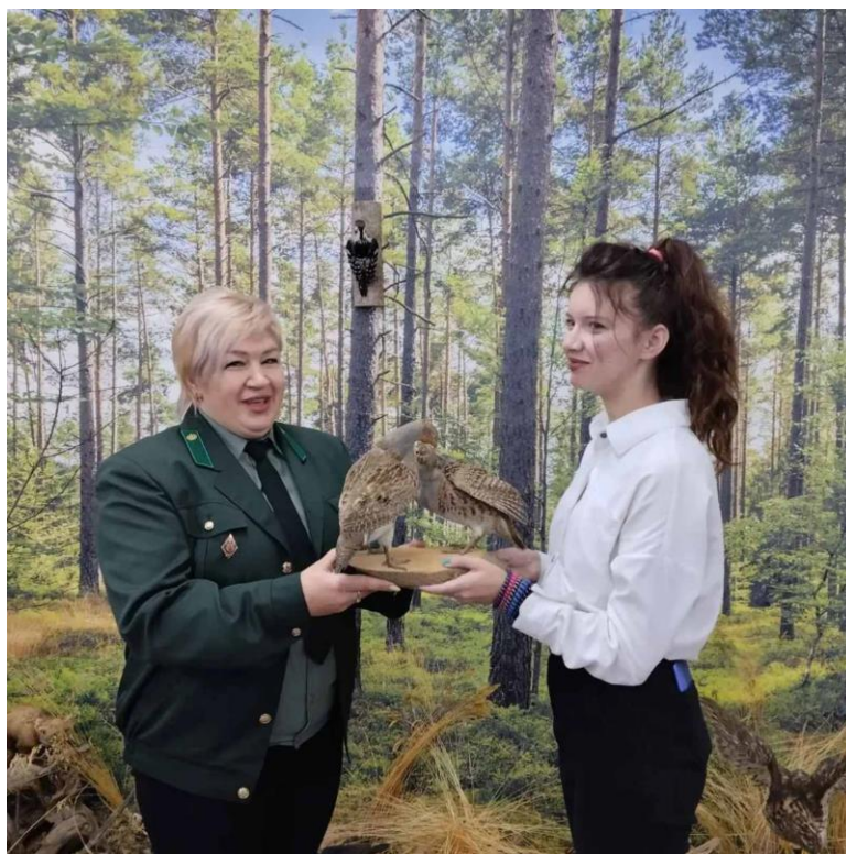
Принимаем подарки от Суражского лесхоза