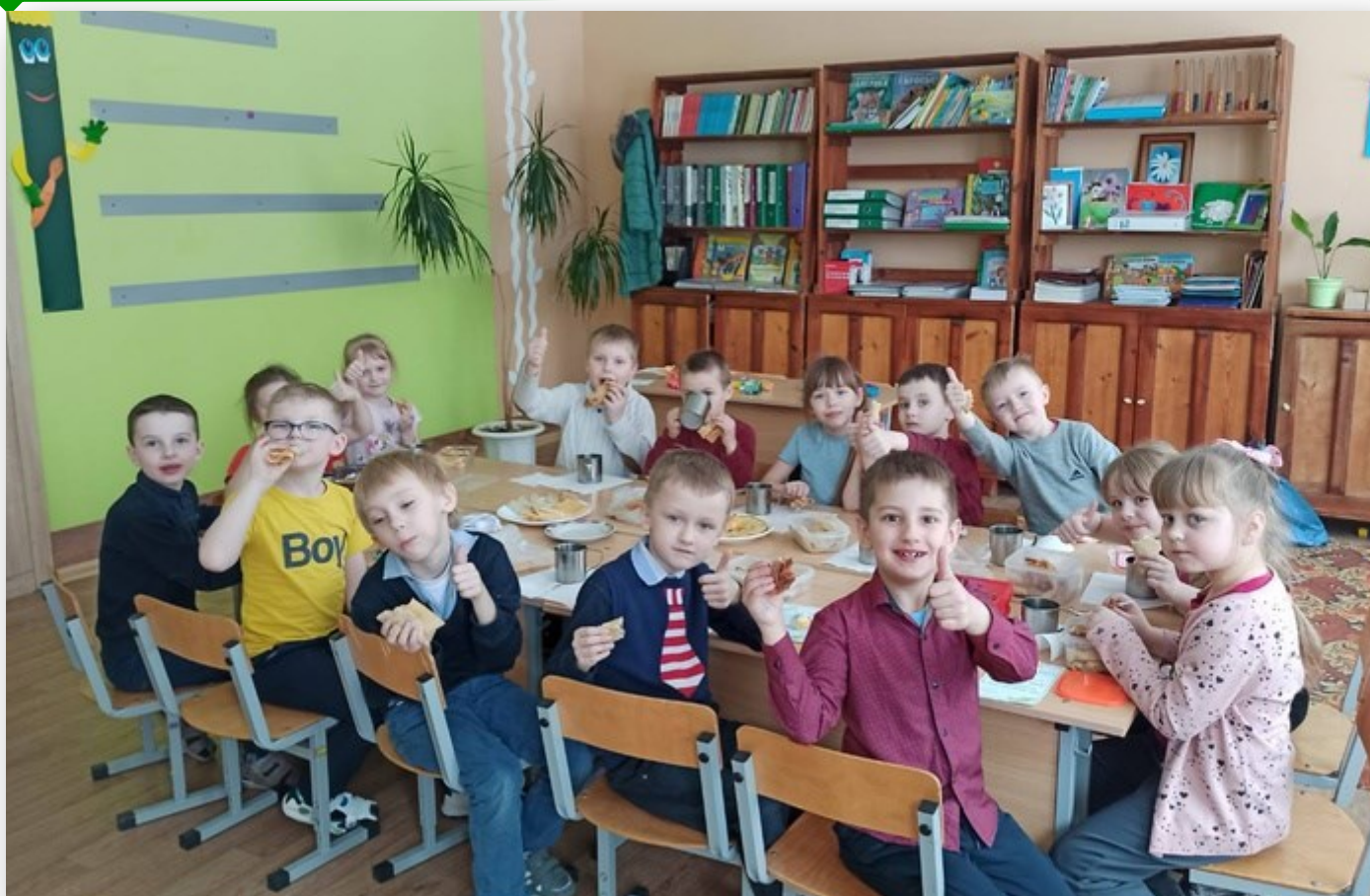
Праздник «Масленица»

Издается в ГБОУ «Верхменская средняя школа им.В.А.Тумара» с 26 декабря 2002