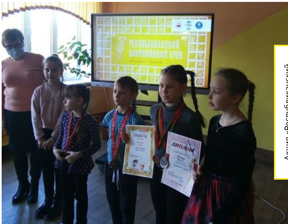
Акция «Республиканский олимпиадный урок»

Издается в ГУО «Верхменская средняя школа им.В.А.Тумара» с 26 декабря 2002