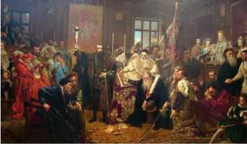
Ян Матейко. Люблинская уния

Таким образом, ВКЛ вместе с Польшей создали общую Речь Посполитую. Такое объединение двух соседних государств называется федерацией - государством, состоящим из самостоятельных государственных образований, объединённых на определённых условиях в одну страну.