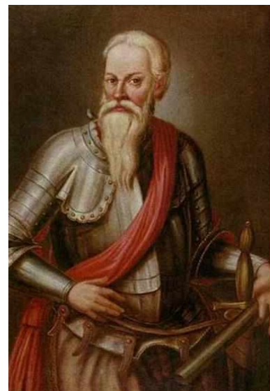
Николай Радзивилл Рыжий

Условия объединения Польши и ВКЛ были выработаны на Люблинском сейме, который состоялся в 1569 г. и длился 6 месяцев. Польская сторона стремилась к инкорпорации (включение, присоединение) ВКЛ в состав Польни (Короны), опираясь на католических феодалов и католическую церковь. Делегация ВКЛ во главе с канцлером ВКЛ Николаем Радзивиллом Рыжим выступала за заключение равноправного союза с Польшей.