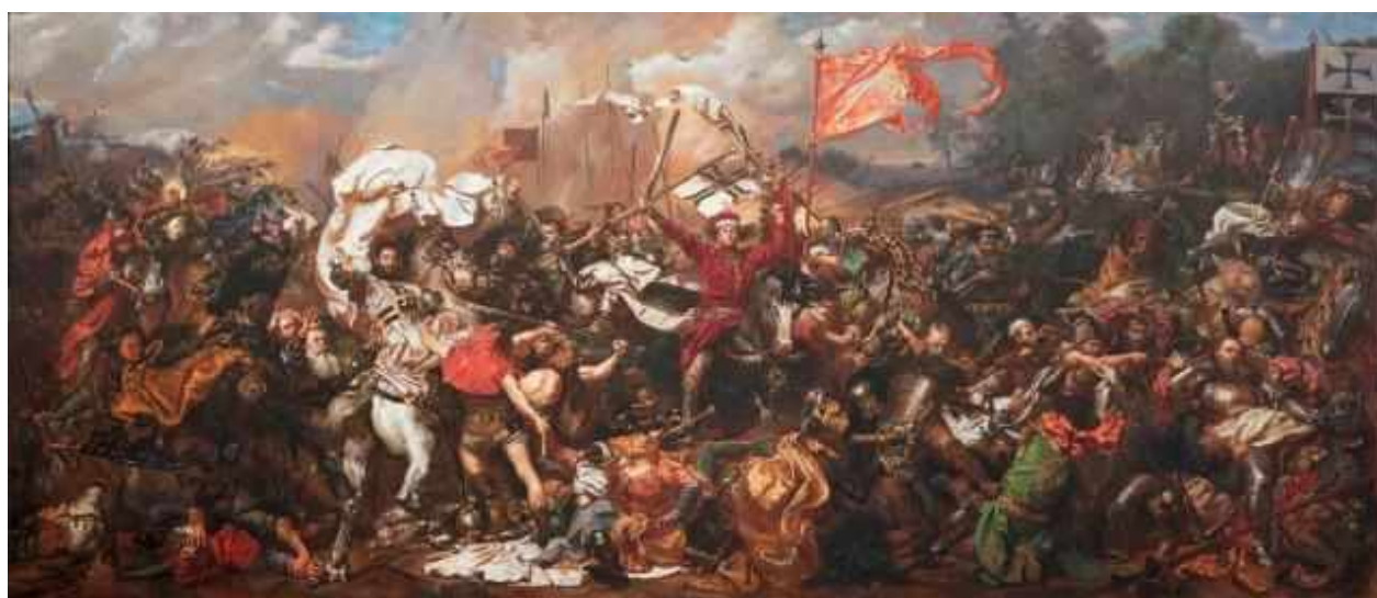
Ян Матейко. Грюнвальдская битва