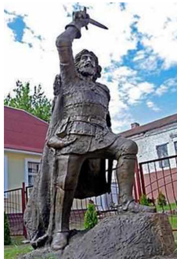
Памятник Андрею Ольгердовичу в Полоцке

Центром защиты Подвинья от крестоносцев стал Полоцк. Здесь княжил Андрей Ольгердович (Андрей Полоцкий). Он вёл основные военные действия с городом крестоносцев Динабургом. Этот город находился вблизи от Полоцка и всё время угрожал ему. Не раз полочане опустошали крепости Динабурга и других замков крестоносцев. Князь Андрей Полоцкий сражался не только с крестоносцами, но и с татарами. В союзе с московским князем Дмитрием Ивановичем он участвовал в 1380 г. в Куликовской битве против ордынцев. Через несколько лет службы у московского князя Андрей Полоцкий вернулся в ВКЛ и перешёл на службу к Витовту. Окончил жизнь знаменитый князь на поле боя во время битвы с правителями Золотой Орды на реке Ворскле в 1399 г.