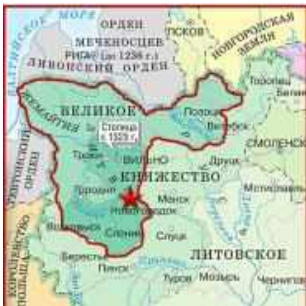
ВКЛ при Витене в 1315 г.