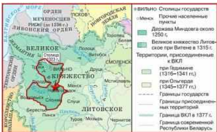
Государство Миндовга около 1250 г.

Великий князь Миндовг и его последователи стали первыми государственными руководителями ВКЛ. Летопись сообщает о Литве Миндовга, одного из местных балтских князей, который в результате междоусобной борьбы вынужден был направиться с остатком своего войска с балтской территории в Новогрудок. Здесь языческий князь принял христианство и сделал город своей резиденцией.