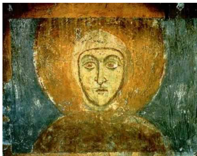
Фреска из Спасо-Евфросиниевской церкви в Полоцке. XII в.

Христианские церкви обычно украшались фресками и иконами. Так, в Спасо-Евфросиниевской церкви все стены и столбы были расписаны фресками. Фреска - это живопись водяными красками по свежей штукатурке. На тёмном фоне изображались фигуры святых. Первое, что невольно обращает на себя внимание, - лица людей, их дугообразные брови и большие, задумчивые глаза. Так художники стремились передать внутренний мир верующего человека, выразить своё понимание прекрасного.