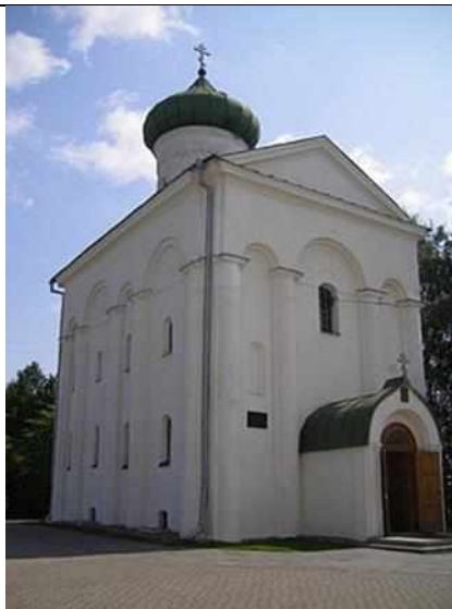
Современный вид Спасо-Евфросиниевской церкви в Полоцке

Христианские церкви обычно украшались фресками и иконами. Так, в Спасо-Евфросиниевской церкви все стены и столбы были расписаны фресками. Фреска - это живопись водяными красками по свежей штукатурке. На тёмном фоне изображались фигуры святых. Первое, что невольно обращает на себя внимание, - лица людей, их дугообразные брови и большие, задумчивые глаза. Так художники стремились передать внутренний мир верующего человека, выразить своё понимание прекрасного.