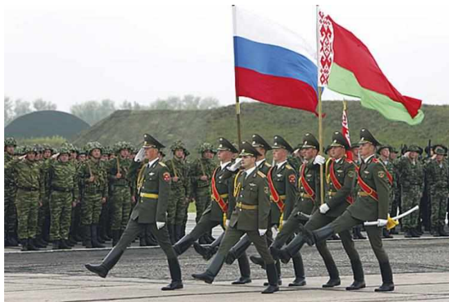
День единения народов Беларуси и России. Совместный парад