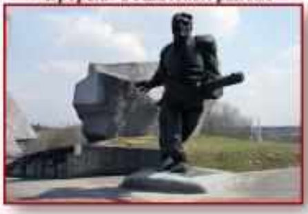
Мемориальный комплекс «Прорыв» в Ушачском районе