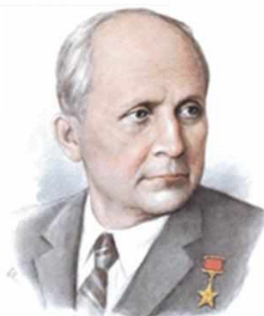
Павел Осипович Сухой

современных Военно-воздушных сил Республики Беларусь. Ему дважды присвоено звание Героя Социалистического Труда.