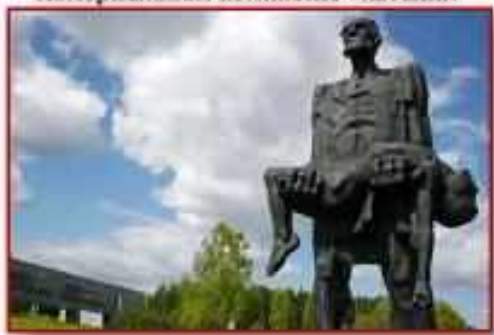
Монумент «Непокоренный человек» в мемориальном комплексе «Хатынь»

Всемирную известность приобрел открытый в 1969 г. мемориальный архитектурно-скульптурный ансамбль в память жертв фашизма «Хатынь», созданный совместно с группой архитекторов скульптором Сергеем Селихановым.