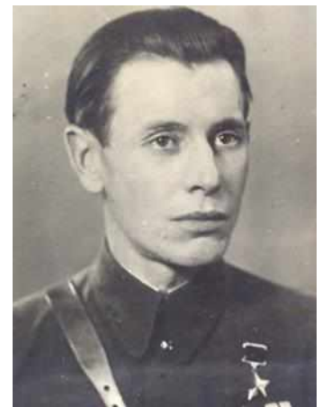
П. М. Машеров

С весны 1942 г. появился новый вид партизанских формирований – бригады. Они создавались на основе объединения отдельных партизанских отрядов. Комиссаром одной из бригад стал Пётр Миронович Машеров . Будучи перед войной учителем физики и математики, он в условиях оккупации создал и возглавил Россонское антифашистское подполье, в 1942 г. была взята в заложники и расстреляна его мать. П. М. Машеров был дважды ранен в бою. Возглавлял Вилейский подпольный областной комитет комсомола. В 26 лет стал Героем Советского Союза.