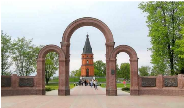
Мемориальный комплекс «Буйничское поле» под Могилёвом