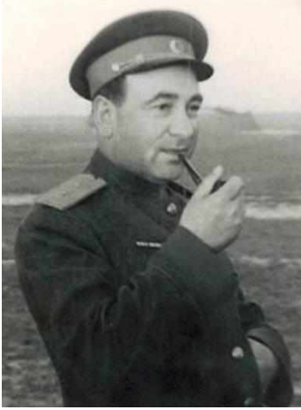
П. К. Пономаренко

и групп, которые объединялись в бригады. Значительно улучшилось вооружение «лесных бойцов». Усовершенствовалась структура партизанских сил, которая все больше приближалась к военной. Особенностью партизанского движения в 1942 г. было то, что оно стало более организованным и эффективным. Этому способствовало создание в мае 1942 г. Центрального штаба партизанского движения (ЦШПД) при Ставке Верховного Главнокомандования во главе с Пантелеймоном Кондратьевичем Пономаренко и в сентябре 1942 г. Белорусского штаба партизанского движения (БШПД) во главе с Петром Захаровичем Калининым .