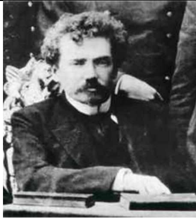
Митрофан Викторович Довнар-Запольский

М.Довнар-Запольский - доктор исторических наук, профессор, фольклорист и этнограф. Наиболее крупные его научные труды посвящены преимущественно социально-экономической истории Беларуси и Литвы. Исследовал государственное хозяйство ВКЛ при Ягеллонах, организацию западнорусского крестьянства в XVI в. Перу М.Довнар-Запольского принадлежит брошюра «Основы государственности Беларуси». Всего по этнографии и фольклору опубликовал более 30 работ.