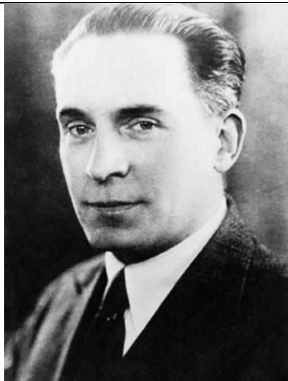
Александр Леонидович Чижевский

О. Шмидт – уроженец Могилева, ученый, полярник. Руководитель экспедиции (1934) в Арктику на корабле «Челюскин», который был раздавлен льдами. После спасения «челюскинцам» и ему было впервые присвоено звание Героя Советского Союза. При его участии в 1937 г. была открыта первая в мире дрейфующая научная станция «Северный полюс». Занимался изучением космического пространства, сформулировал новую теорию «холодного» образования Земли и планет из допланетного газопылевого облака. В первые годы советской власти издал научный труд «Математические законы денежной эмиссии», который высоко оценил В.И. Ленин. Дал математическое обоснование наличия железных руд на Курской магнитной аномалии.