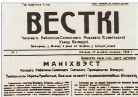
Газета «Вести» с текстом Манифеста о провозглашении ССРБ

5 января 1919 г. Временное правительство ССРБ переехало из Смоленска в Минск, который стал столицей ССРБ.