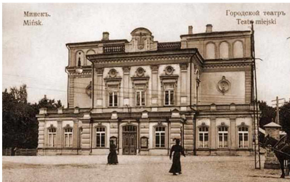
Здание Минского городского театра, в котором работал I Всебелорусский съезд

Участники съезда признали всероссийскую советскую власть, однако съезд игнорировал существование Облискомзапа. Делегаты съезда приняли решение создать из своего состава Всебелорусский Совет крестьянских, рабочих и солдатских депутатов и передать ему всю власть в крае. Тем самым не признавались и отлучались от власти Советы рабочих, крестьянских и солдатских депутатов, их исполнительные органы, которые были созданы на неоккупированной части территории Беларуси в октябре - ноябре 1917 г. С точки зрения большевиков, это было не что иное, как попытка контрреволюционного государственного переворота.