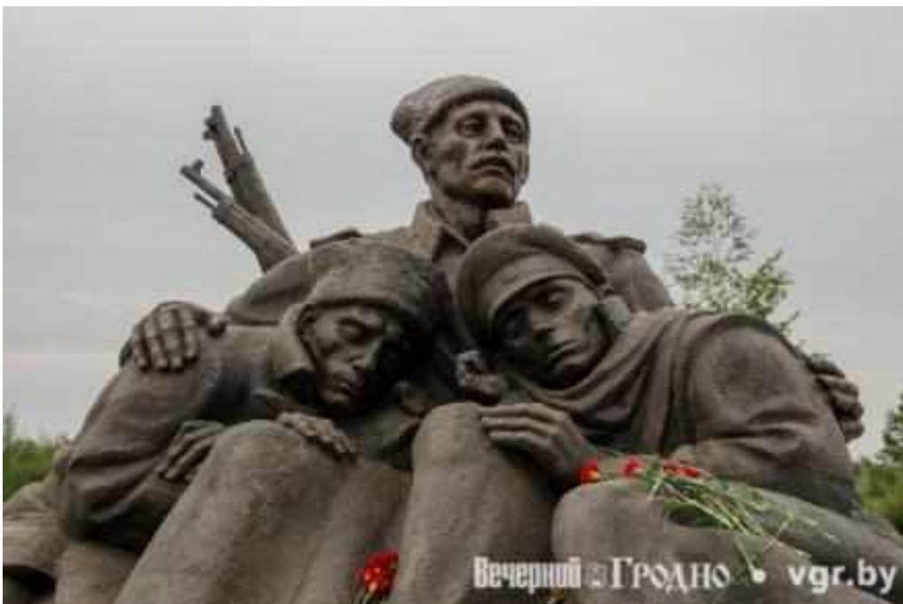
Скульптурная композиция «Солдаты Первой мировой войны» в Сморгони

К 100-летию событий Первой мировой войны здесь был создан мемориальный комплекс памяти её героев и жертв.