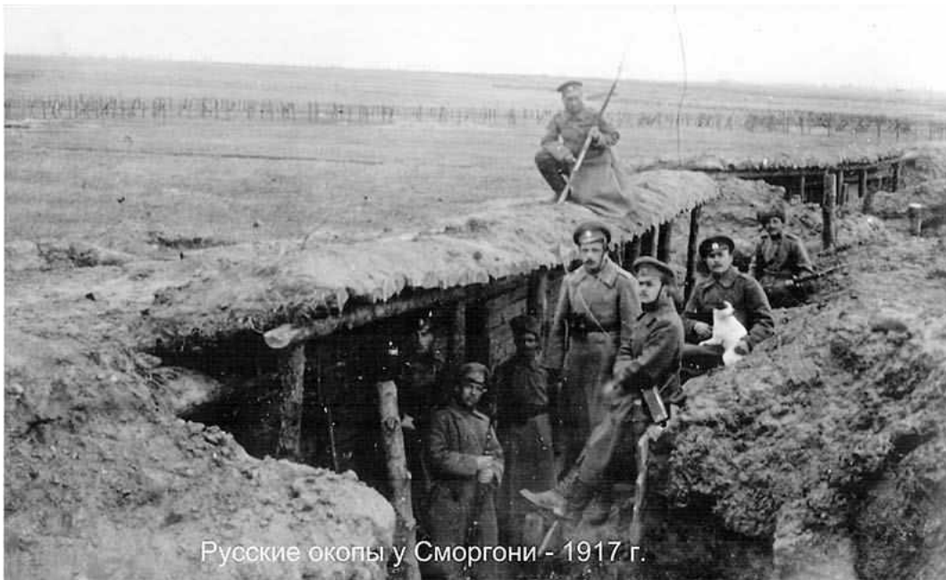
Русские окопы у Сморгони - 1917 г.

Под Сморгонью окопы Первой мировой войны