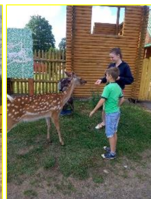
Фото 5. Вольеры с дикими животными