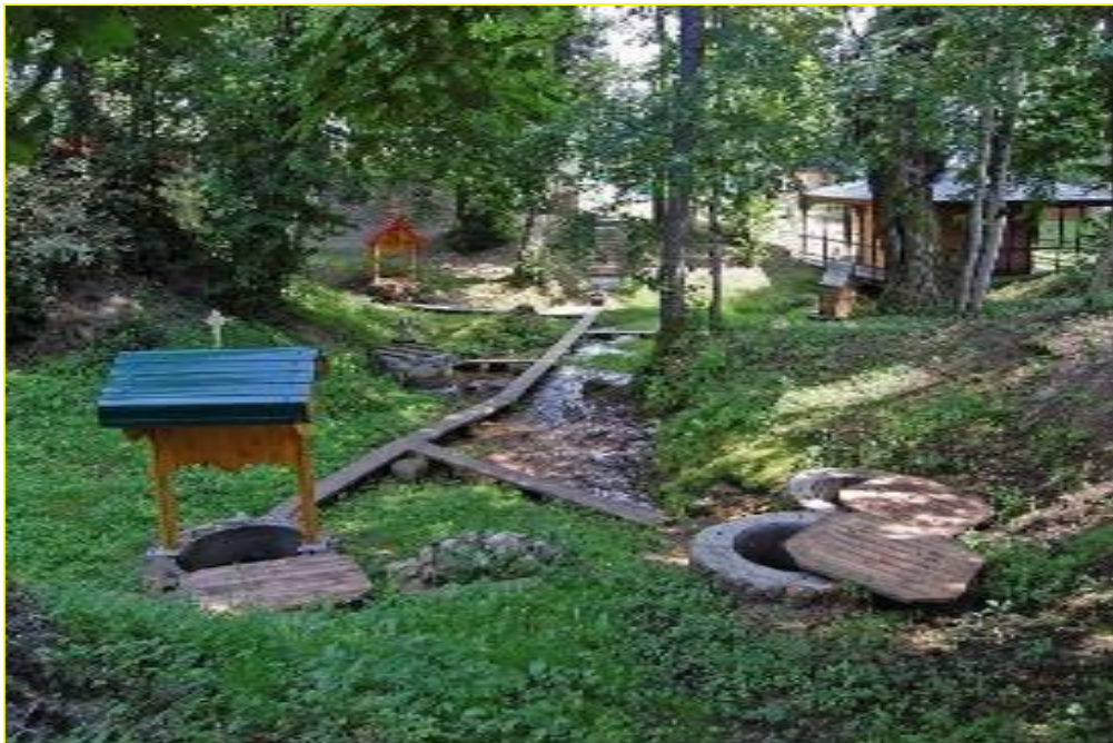
Фото 9. Общий вид источников