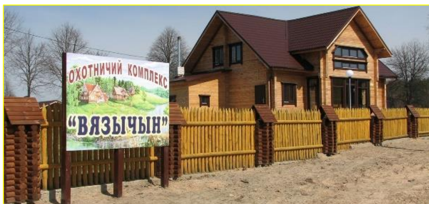
Фото 4 . Охотничий комплекс «Вязычин»