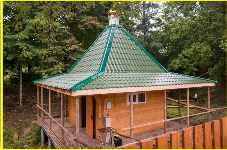
Фото 9. Купель