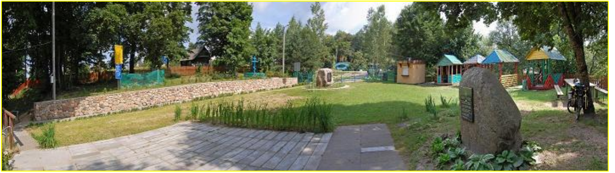
Фото 7. Комплекс в д. Крупа

Часовня с купелью на семи источниках в честь святителя Николая Чудотворца