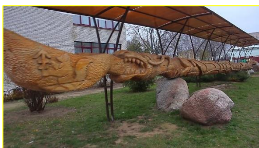
Фото 2. Памятник деревянной ложке