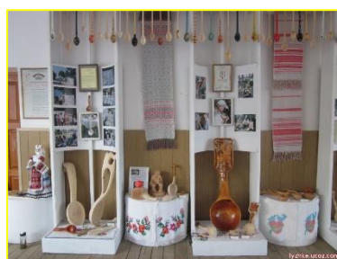
Фото 3. Музей деревянной ложки г.Березино