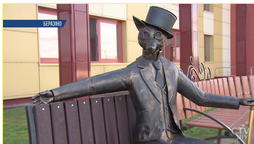
Фото 1. Лис- символ Березинского района