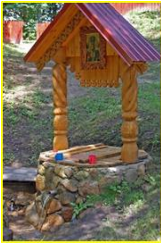
Фото 8. Источник

Часовня с купелью на семи источниках в честь святителя Николая Чудотворца