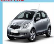
ТРАНСПОРТНЫЕ СРЕДСТВА (FM-радио)