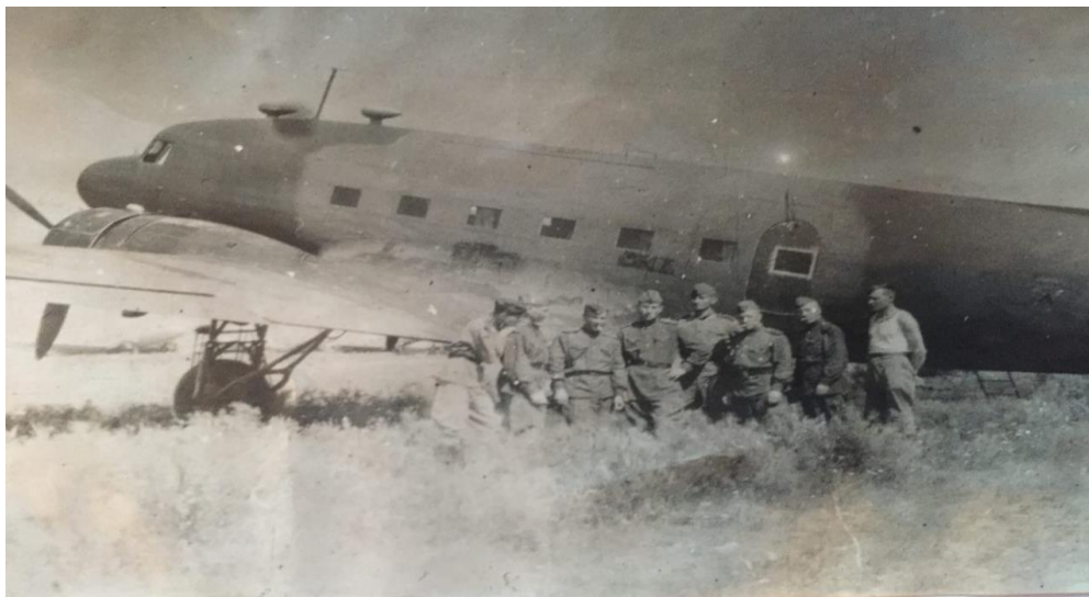
Лето 1942 г.