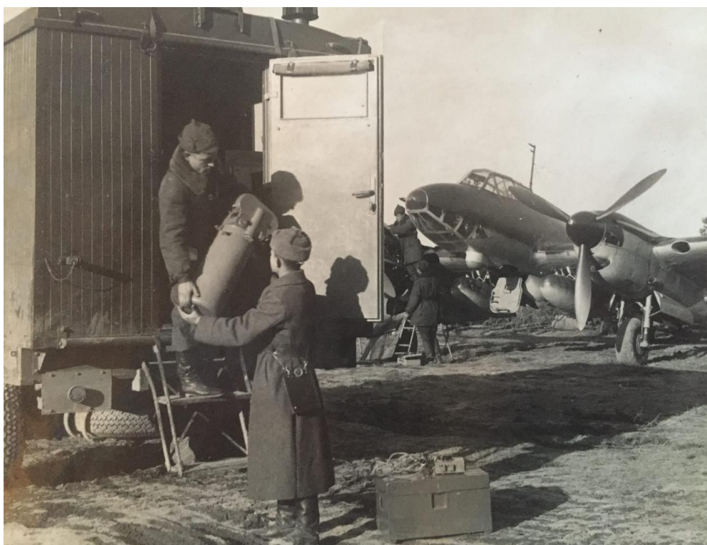
После боевого задания