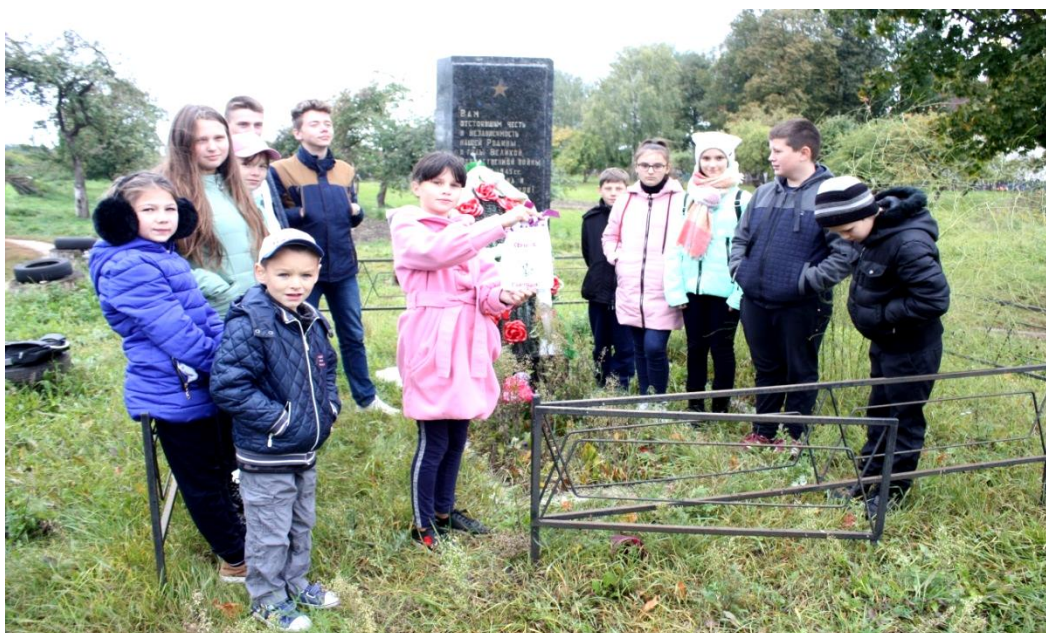
Вучні Сёмкаўскай СШ каля Брацкай магілы савецкіх воінаў ў в. Сёмкаў Гарадок.

Найбліжэйшая да нашай школы брацкая магіла савецкіх воінаў ў в. Сёмкаў Гарадок. Магіла размешчана ў цэнтры вёскі, злева ад вясковых могілак і царквы ў гонар Раства Божай Маці (вул. Школьная, 7). Пахаваны 25 воінаў, якія загінулі ў баях з нямецка-фашысцкімі захопнікамі ў цэрвені 1941 г. і ў ліпені 1944 г. 1950 г. на магіле ўстаноўлены абеліск, у 1975 г. – новы помнік. 4