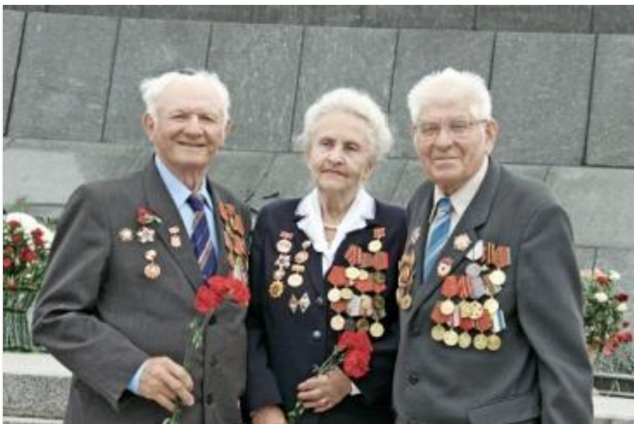
У монумента Победы в Минске, 2011 г.