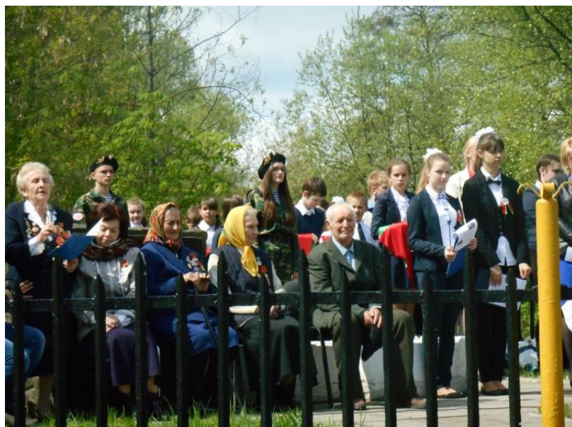
На Братской могиле д.Подгай 9 мая 2017 г.