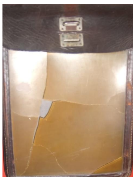
Планишетная сумка Матрунчика