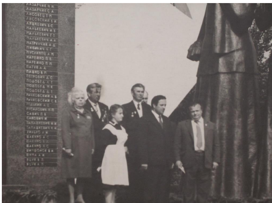
Памятник в парке д. Чуриловичи

Ежегодно, в день Победы, учащиеся нашей школы приходят сюда на митинг, чтобы почтить память павших земляков.