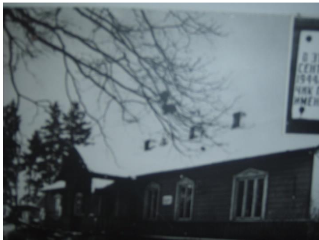
Здание Кайковского лесничества

После войны мы узнали, что в здании, где находилось управление Кайковского лесничества, с сентября 1942 года по июнь 1944 года работал радиопередатчик партизанской бригады имени Калинина».