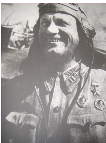
Герой Советского Союза Матрунчик Иосиф Васильевич

Ученик. Настоящим асом – бомбардировщиком встретил войну Иосиф Васильевич Матрунчик. Его подвиг во время советско-финской войны был отмечен в 1940 году званием Героем Советского Союза.