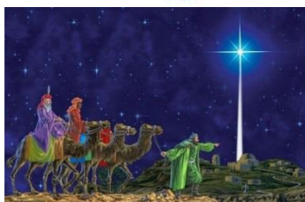
Вифлеемская рождественская звезда