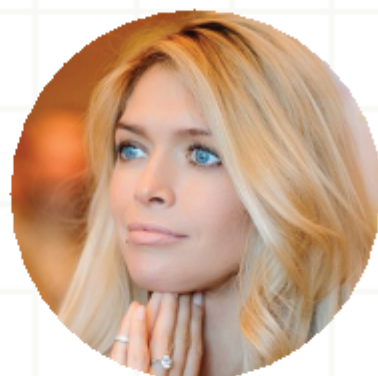
Вера Брежнева, певица, Посол доброй воли ЮНЭЙДС

«Нужно знать все о ВИЧ и о том, как защитить себя. Это ваше здоровье и ваша жизнь. Убеждать кого-то в необходимости сохранить здоровье можно только собственным примером»