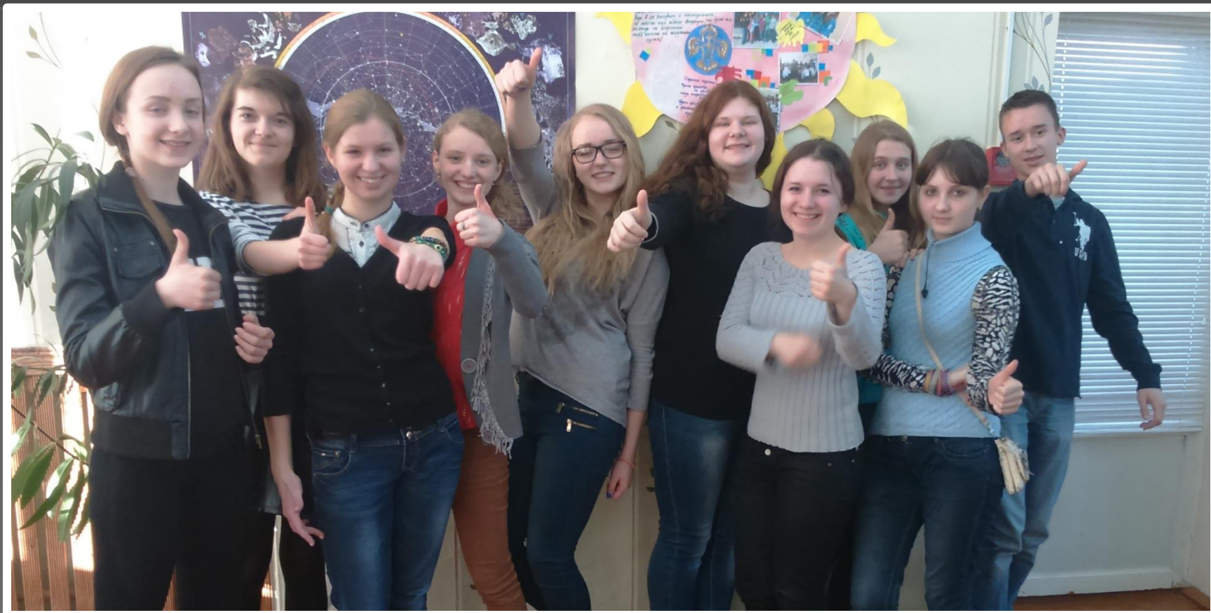
ГРУППА ВОЛОНТЁРОВ-ИНСТРУКТОРОВ ГУО «СРЦДМ» Г. СМОРГОНЬ