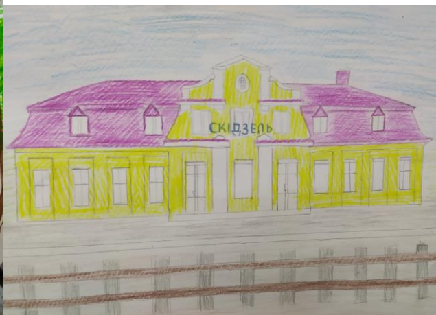
Рис. Елизаветы Грецкой