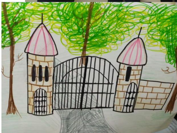
Рис. Марии Иоскевич