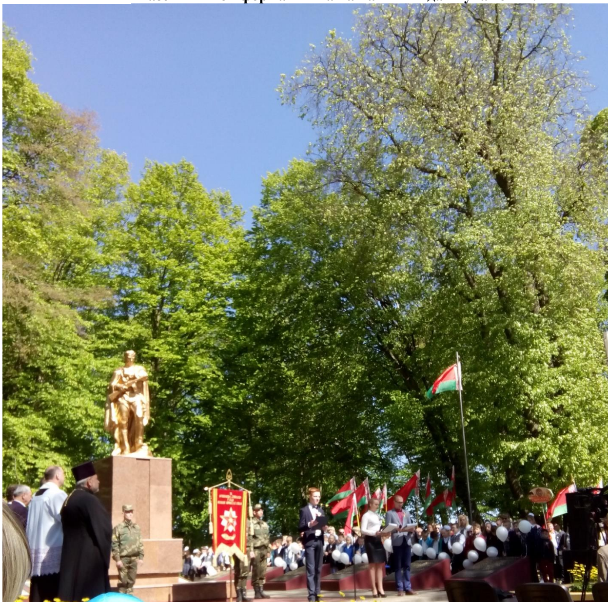
На фото: митинг-реквием, посвященный Дню Победы, у памятника на братской могиле в городском парке Скиделя.

В этом номере мы расскажем судьбах героев и простых людей, но все эти судьбы опалила война. И выпуск школьной газеты «Твой формат» – наша память и дань уважения.