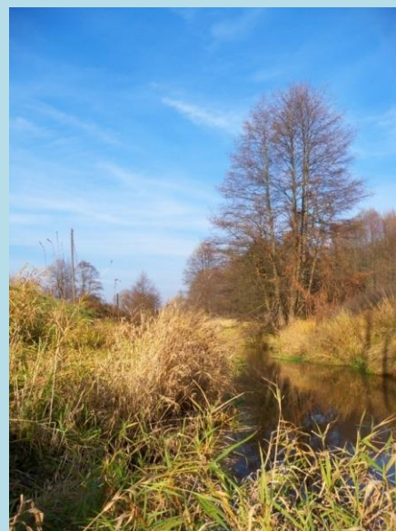
Осень в окрестностях Каменки.