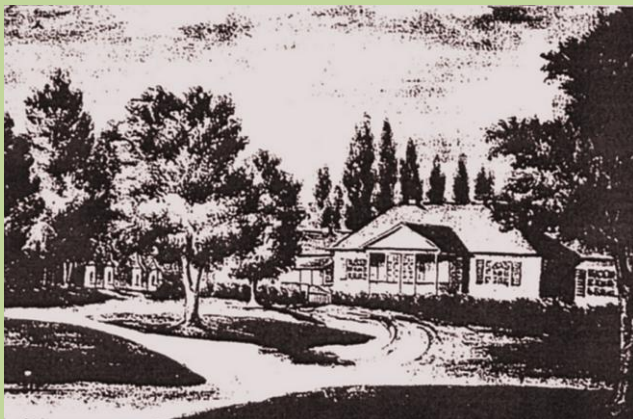
Парк Четвертинских. 19 в. Рис. Наполеона Орды.

Основу насаждений парка составляют деревья ясеня, клена, липы, граба. Редкие деревья высажены в виде одиночных экземпляров. Сохранилась айва японская, ясень обыкновенный, сосна веймутова, орех серый, липа крупнолистная и очень редкая для Беларуси липа каролинская.