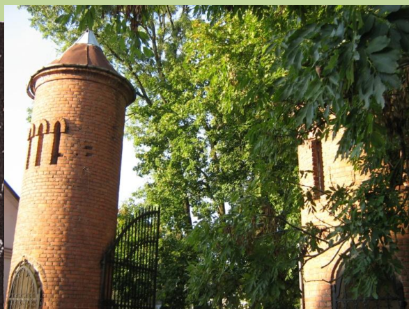
Въездные башни в парк Четвертинских.

Серьезным испытанием для парковых растений стали суровые зимы 1928 – 1929 гг., 1939 – 1940 гг. От низкой температуры пострадали не только экзотические растения. В парке частично вымерзли даже крупные деревья местных видов. Также огромный ущерб садово-парковому искусству Скиделя нанесли войны 1914 г., 1941 – 1945 г. Многие растения погибли, а сохранившиеся объекты парка претерпели изменения.