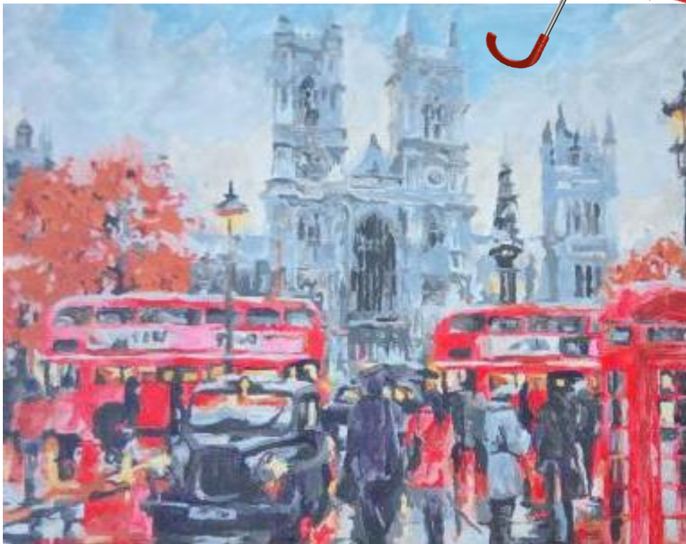
Худ. Полина Богдей