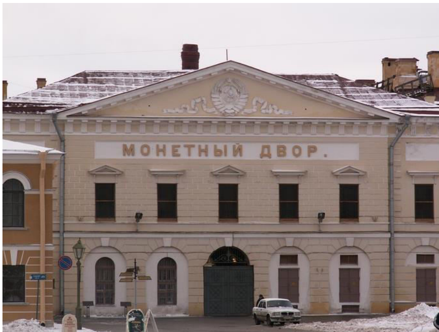
Санкт – петербургский монетный двор

Вот так чеканят и печатают современные деньги