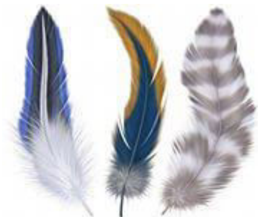
Перья редких птиц