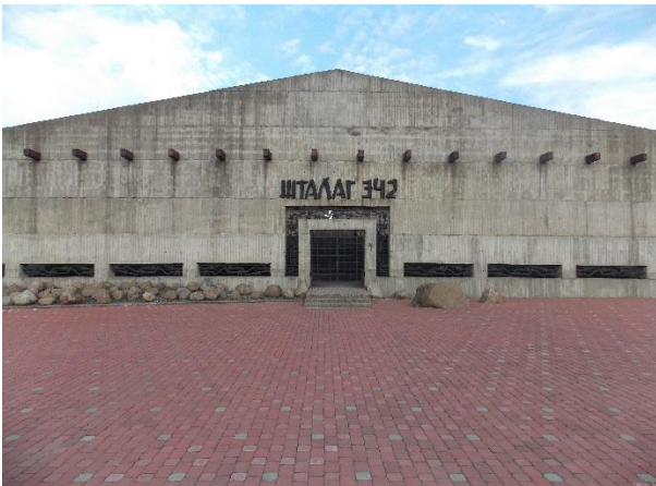
Мемориальный комплекс «Шталаг-342» расположен на ул. Замковая.