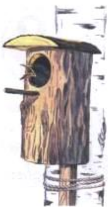
Скворец на скворечнике. (В)

7. Упражнение «Исправь ошибки»: Рассмотри картинки. Послушай предложения и исправь ошибки.