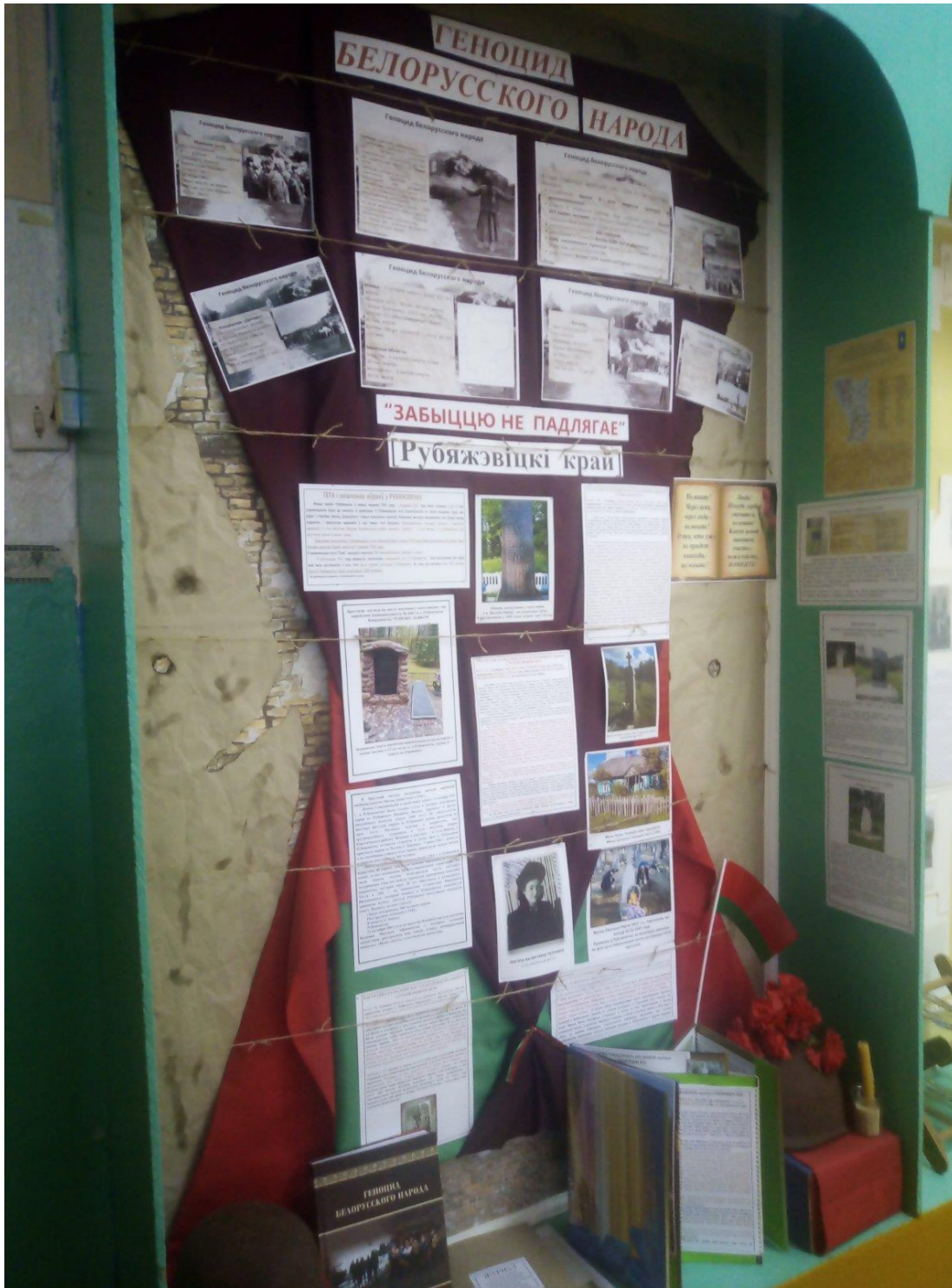
Создание экспозиции, посвящённой геноциду белорусского народа в годы Великой Отечественной войны «Забыццю не падлягае» начато 1 марта 2022 года