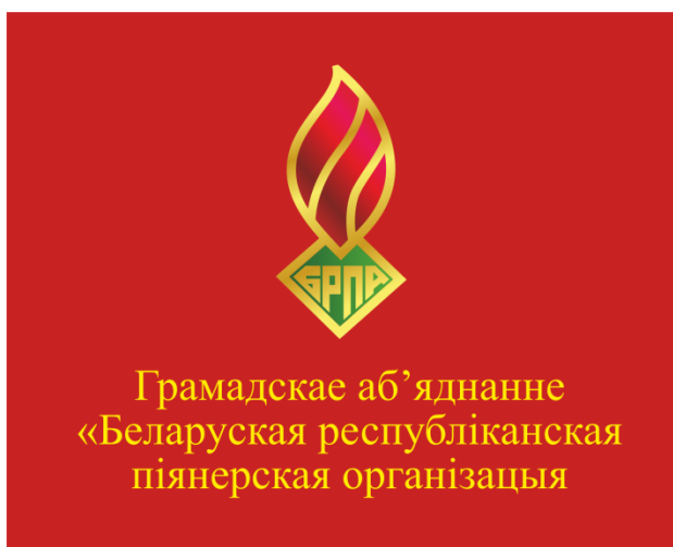
Знамя ОО «БРПО» (лицевая сторона)