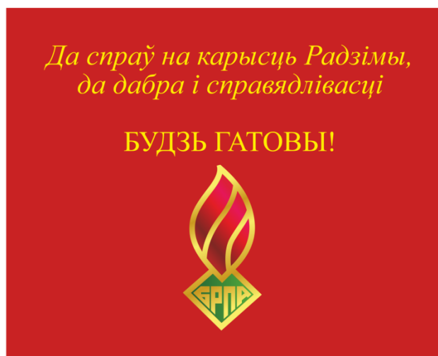
Знамя ОО «БРПО» (оборотная сторона)