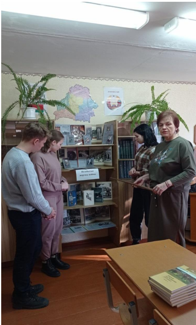
Библиотечная экскурсия «Незабытые жертвы войны», 9-е классы