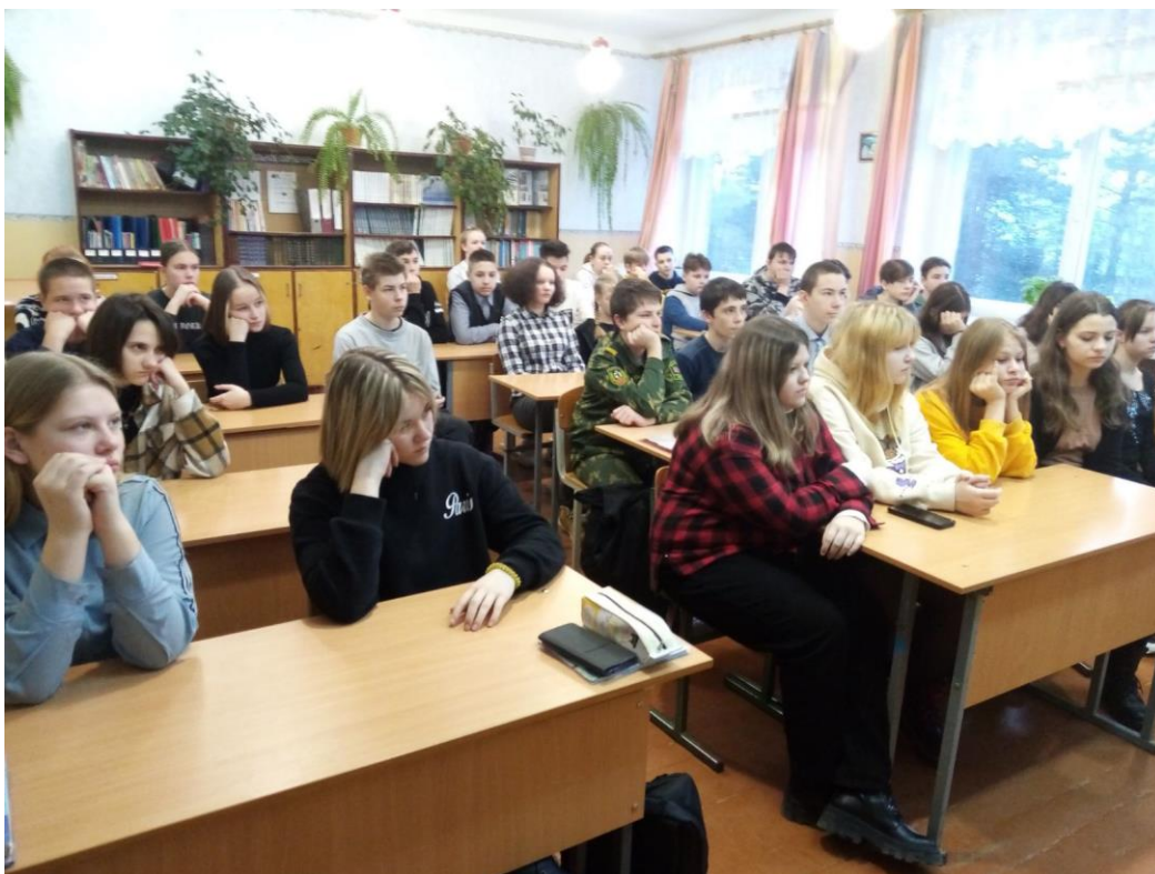
Исторический турнир «Петровская эпоха», 8-е классы