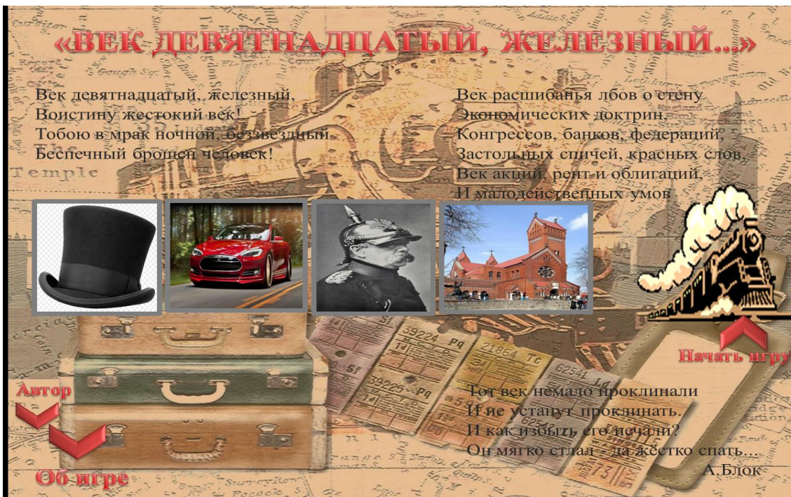
«Лента времени», историческая игра, 10 класс