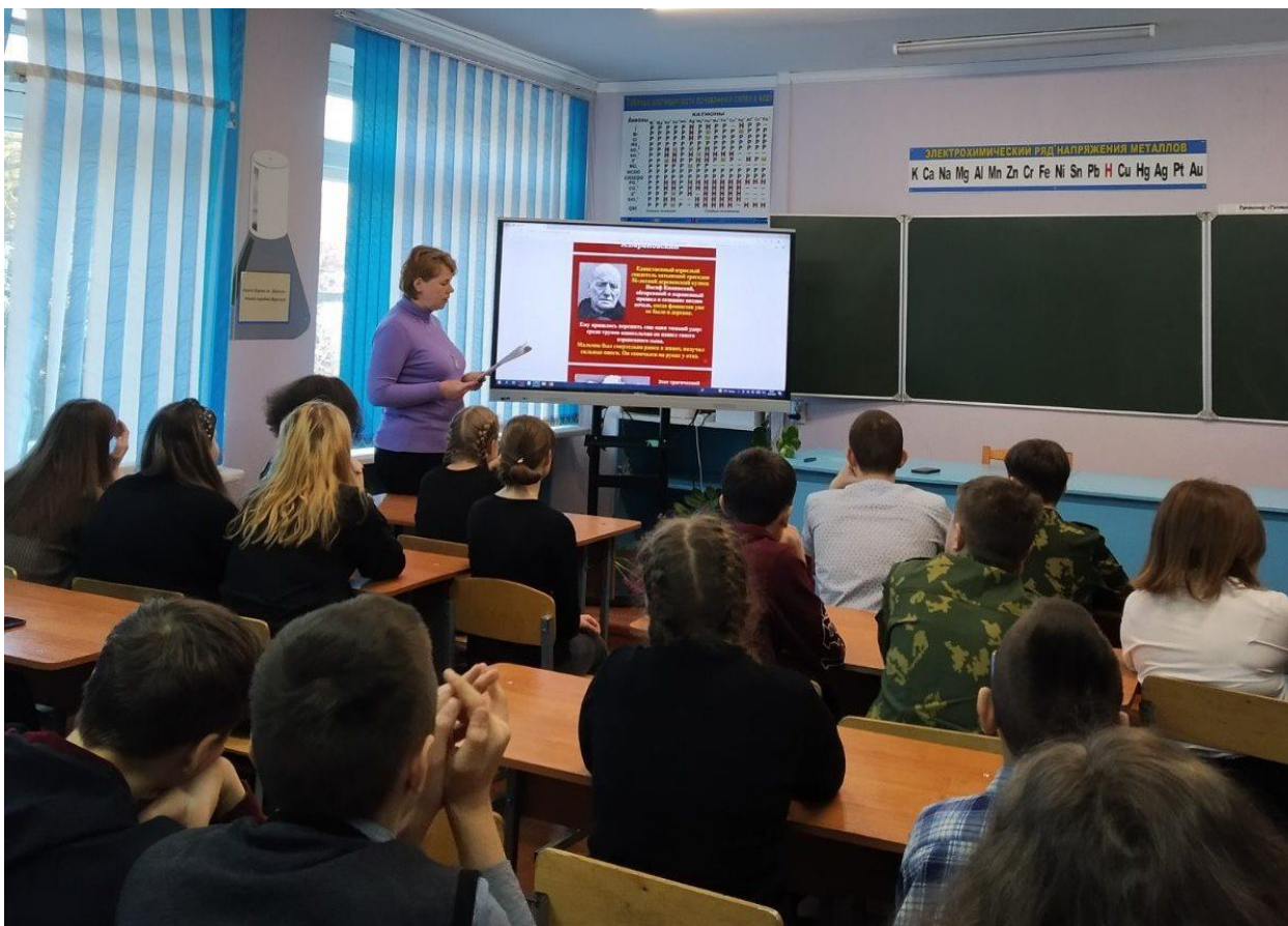
Урок памяти «О чем звонят колокола Хатыни»