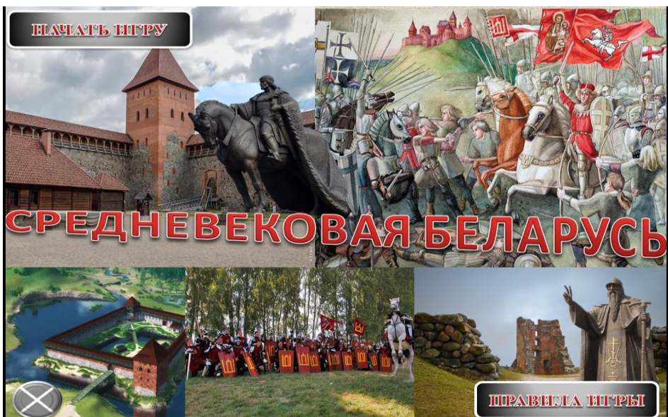
«Средневековая Беларусь», историческая игра, 7классы