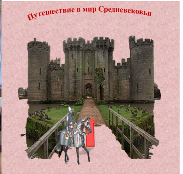
«Путешествие в мир Средневековья», историческая игра, 6-е классы