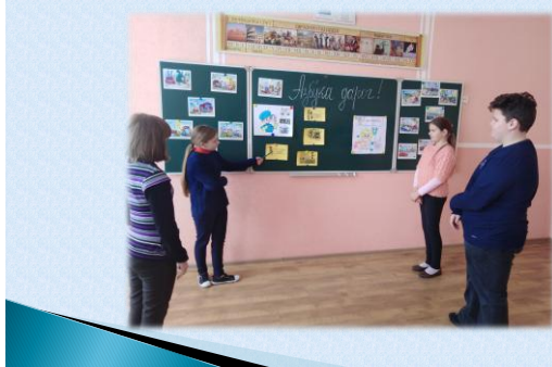
Информационный час «Азбука дорог» в 6 классе