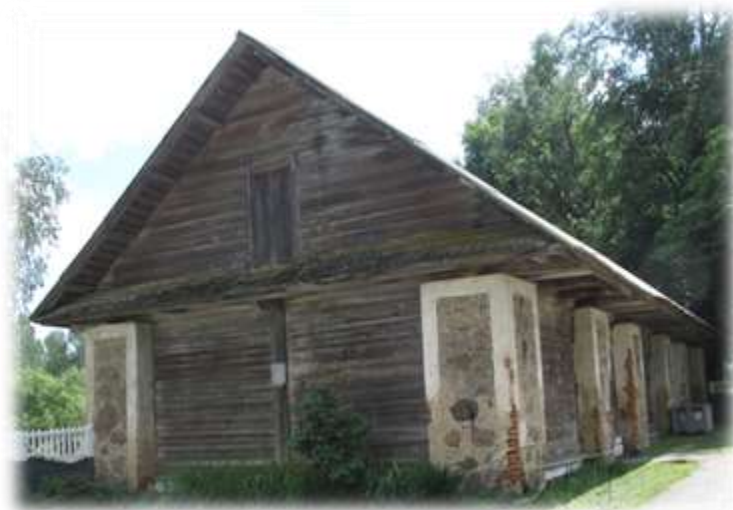
Амбар на территории Копыльской вспомогательной школы-интерната