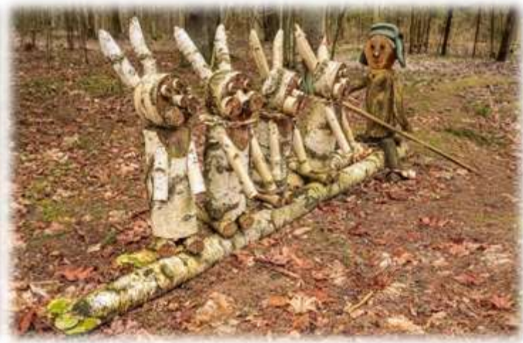
Информационный стенд и «зайки» на «Тропе наших открытий»