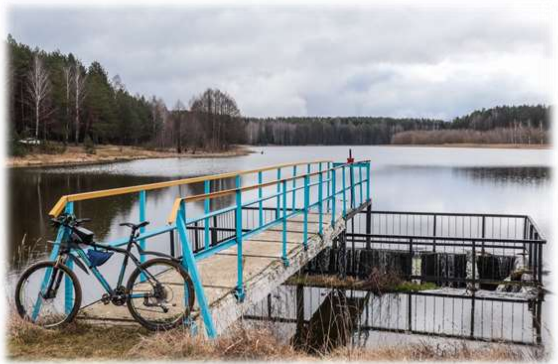
Дамба на р. Турья