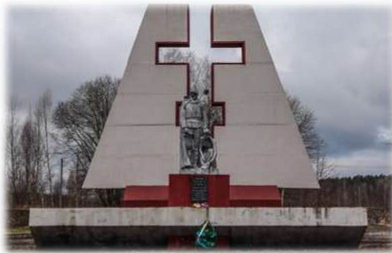
Скульптурный памятник посвящен 130 мирным жителям деревни Масевичи, сожженной 2 февраля 1943 года