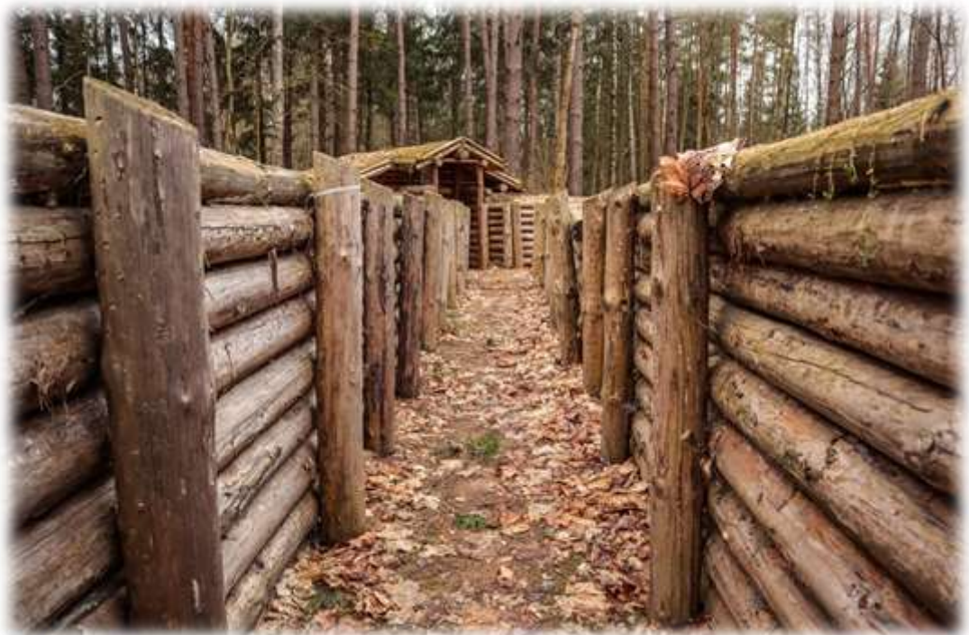
Землянки — историческое место, где в 1942 году находился госпиталь партизанской бригады имени К. Ворошилова.