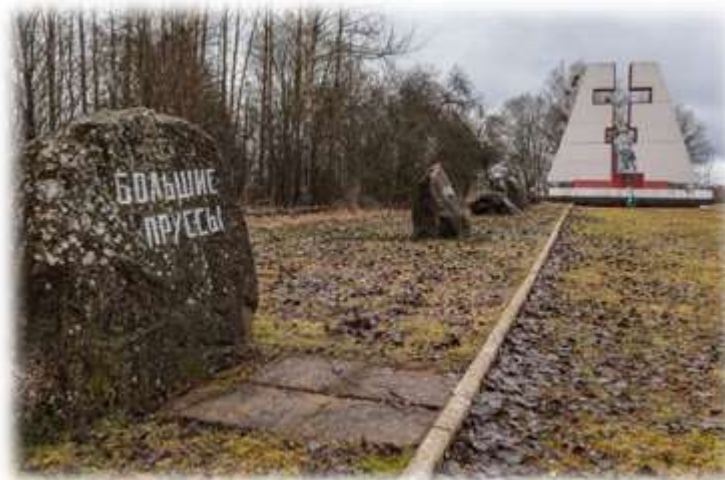
Мемориал сожженным во время Великой Отечественной войны деревням Копыльского района