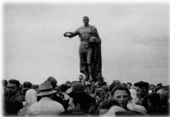
Памятник партизанам, погибшим в Лавском бою 3 декабря 1942 года. (Кладбище возле д. Клетиче)