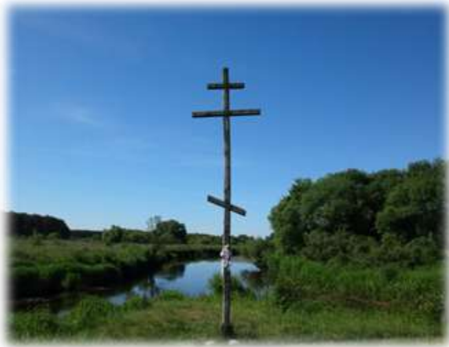
Крест у слияния Усы и Лоши