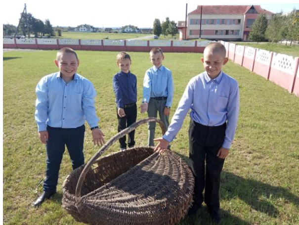
Канструктарскі праект “Макет касцёла ў в. Жупраны”

ПОШУК НОВЫХ ЭКСПАНАТАЎ (+ 45 У 2022 ГОДЗЕ)