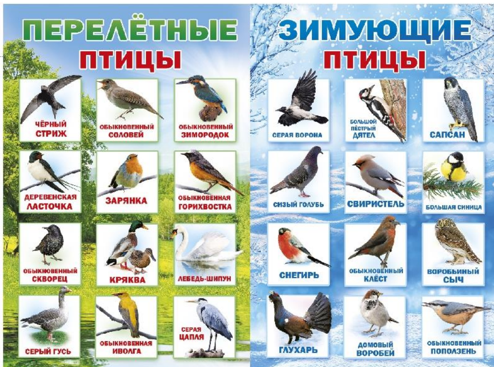
Птицы на кормушках