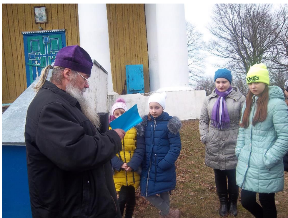
Царква мучаніцы Параскевы в.Старыя Дзявяткавічы