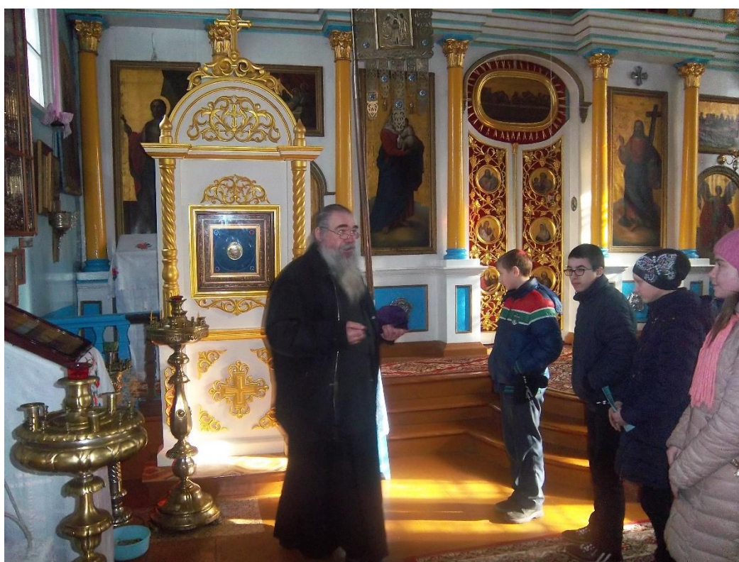
Ікона Смаленскай Божай Маці