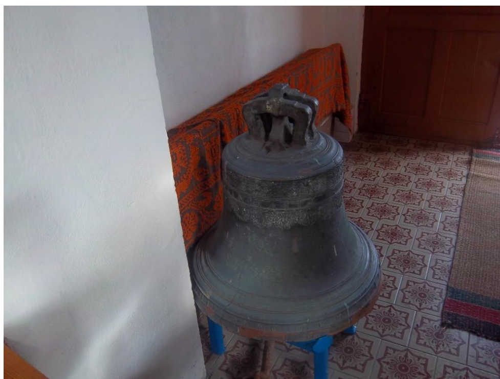
Самы старажытны звон на Беларусі