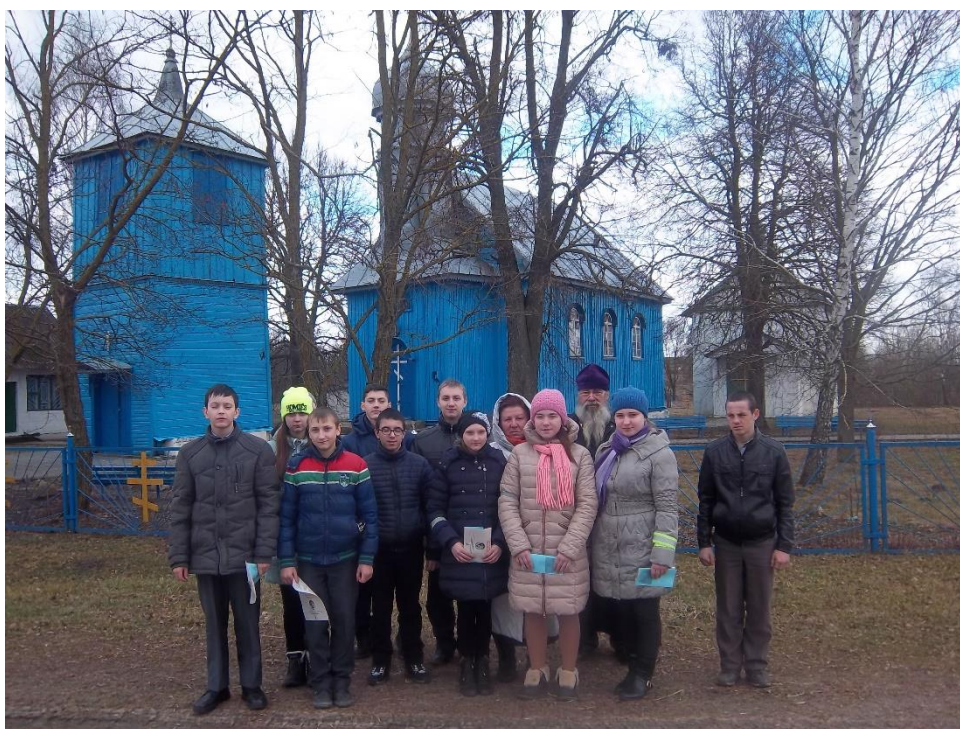
1. Царква Раства Прасвятой Багародзіцы в.Міжэвічы