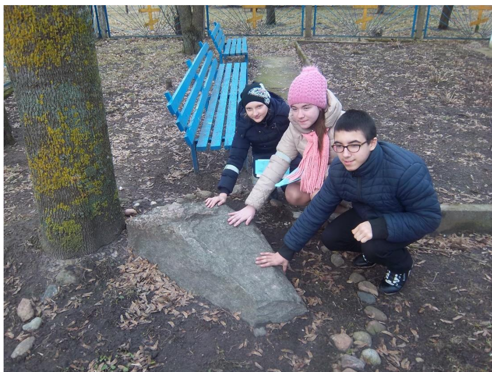
2. Цудадзейны камень каля царквы Раства Прасвятой Багародзіцы