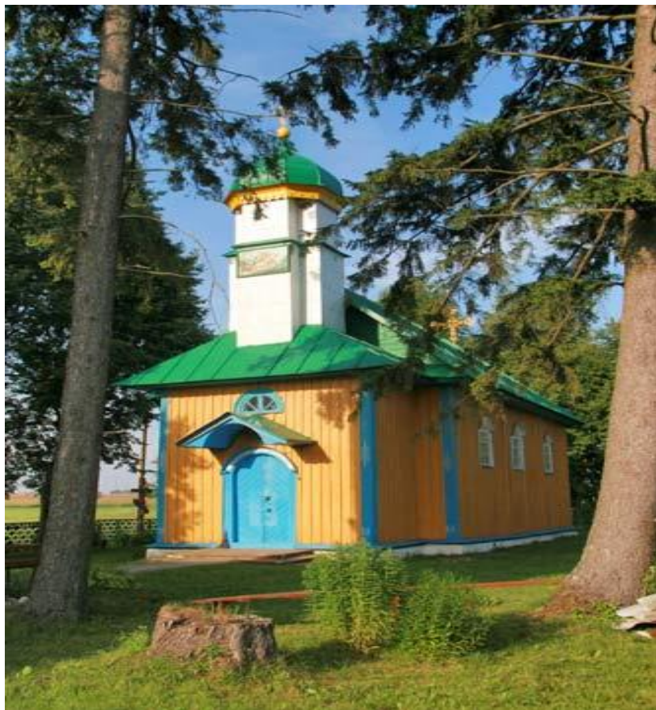
Свята-Глынская царква в.Сурынка