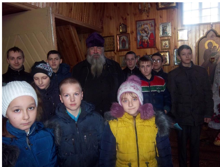
Свята-Георгіеўская царква в.Пасінічы