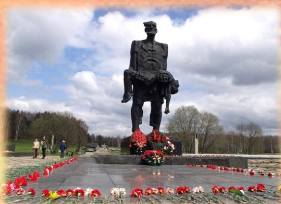
Мемарыяльны комплекс “Хатынь”