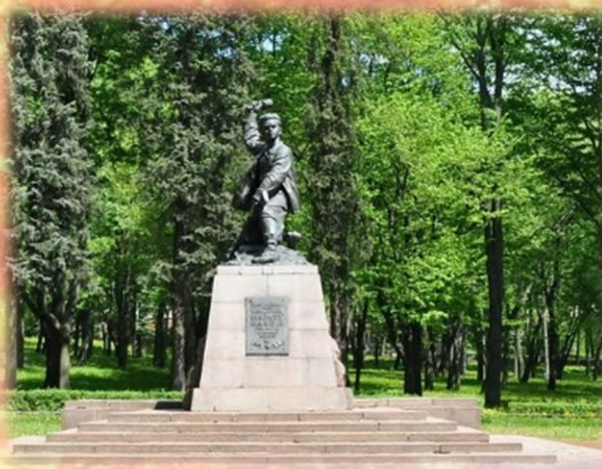
Помнік Марату Казею