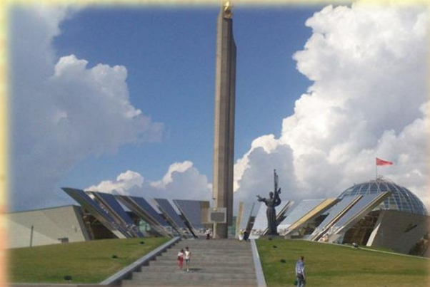
Музей Вялікай Айчыннай Вайны