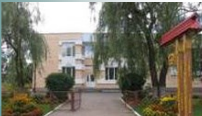
ДУА “Капцянская базавая школа імя Г.С. Грыгор’ева”