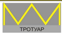
Разметка "Обозначение остановочных пунктов маршрутных транспортных средств и стоянок такси"