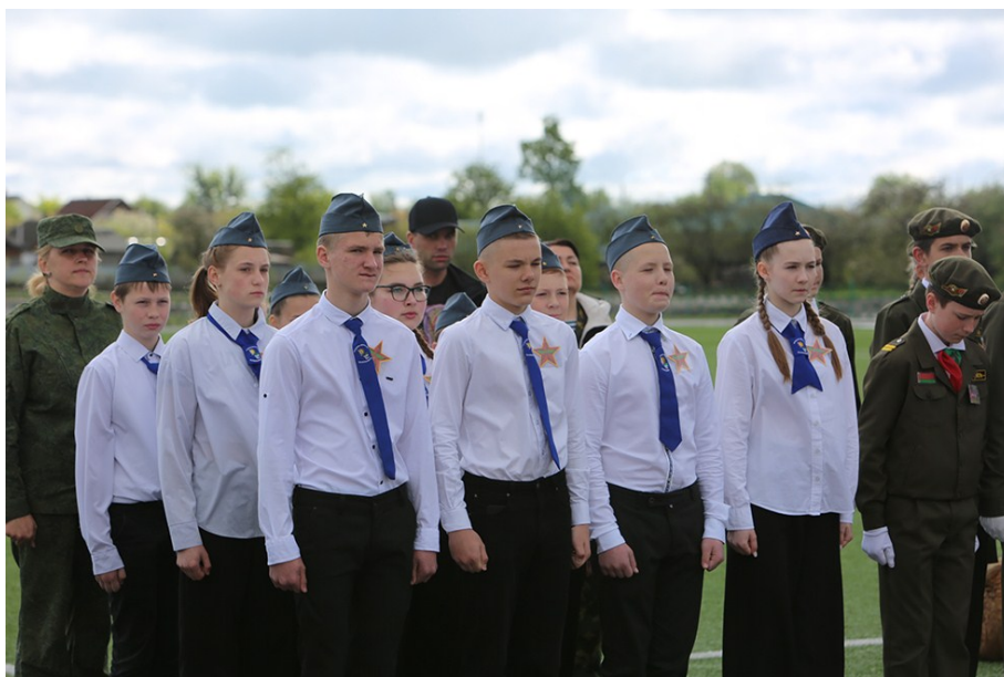
Участники команды «Звезды»

По традиции весной школьники принимают участие в спортивно-патриотической игре «Зарница». Эта игра определяет команду самых лучших, физически подготовленных, смелых и подтянутых будущих защитников Отечества.