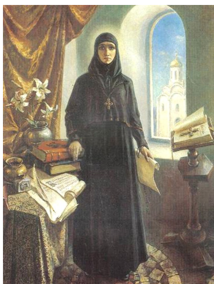
С. Лагуновіч-Чарапко. «Еўфрасіння Полацкая»

“Еўфрасіння сэрца сваё паіла Божаю мудрасцю. Еўфрасіння — незвычайны квет райскага саду. Еўфрасіння — арол, што, лунаючы ў небе, праляцеў ад захаду і да ўсходу, як промень сонечны, прасвятліў зямлю Полацкую”.