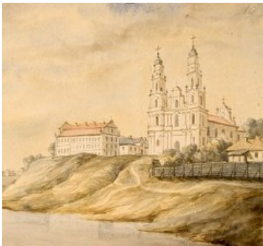
Напалеон Орда. Полацк

Шануй чужое аж да пакланення, сваё любі да самазабыцця.