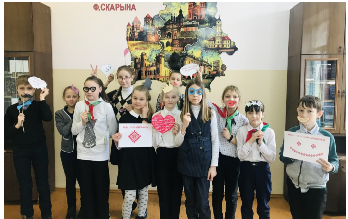
Фотаакцыя «Мова—твая адметнасць»