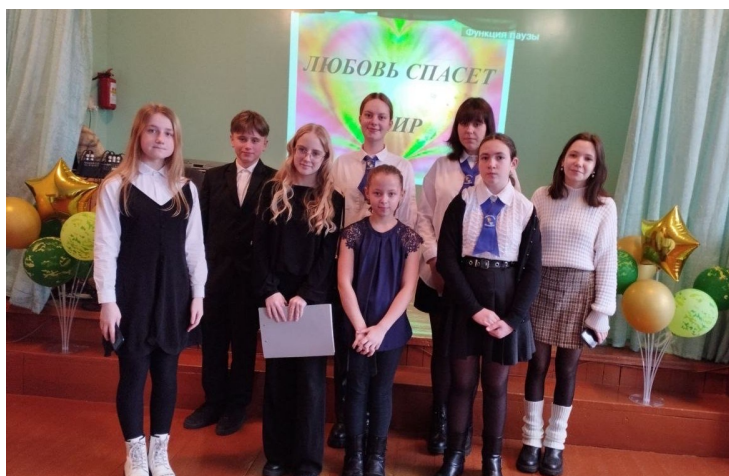
Участники конкурса чтецов