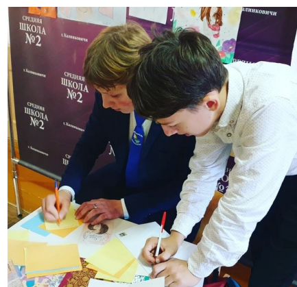
Акция «Поздравим маму вместе»