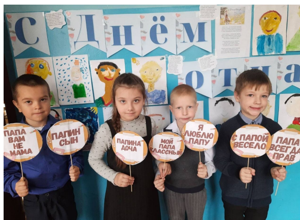
«Любовью матери согреты»