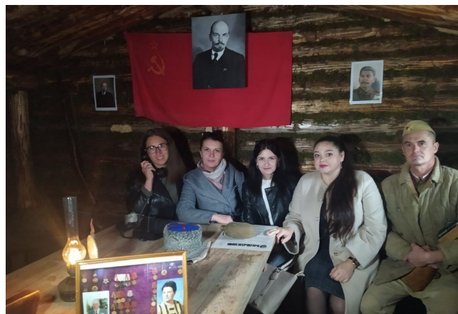
На адкрыцці зямлянкі ў вёсцы Антонаўка

Праведзеныя мерапрыемствы дазволілі кожнаму з нас адчуць сябе часткай вялізнай сям’і – беларускага народа, адчуць адзінства са сваімі сябрамі, роднымі, са сваёй краінай.