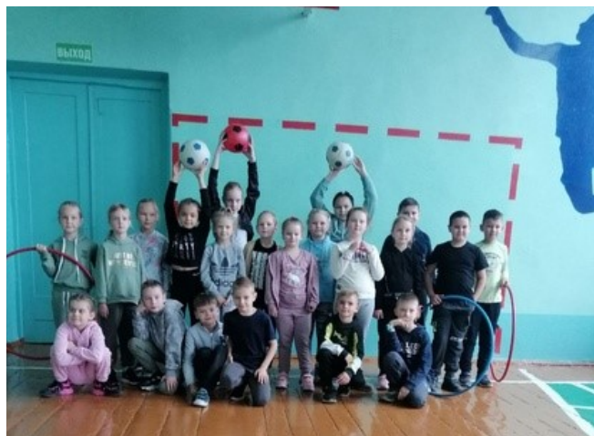
"Спортивные эстафеты", 2-4 классы