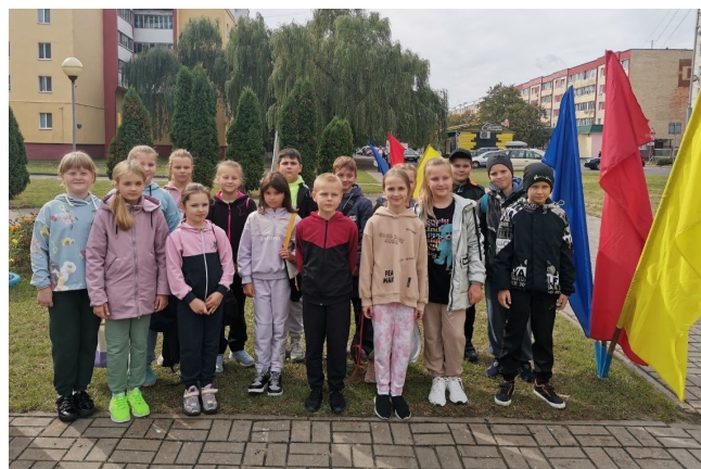
Удзельнікі спартыўнага мерапрыемства