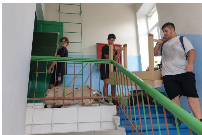
Помощь волонтеров в ремонте школы