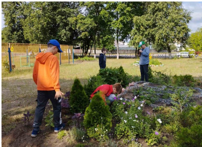
Работа бригады по благоустройству школьной территории

Во время летних каникул в подготовке школы к новому учебному году были задействованы волонтерские отряды и бригада по благоустройству и озеленению школьной территории. С первого дня работы перед ним были поставлены большие задачи: уборка школьной территории, полив цветов, прополка клумб, наведение порядка в спортивном зале, мастерской трудового обучения мальчиков и в учебных кабинетах – вот в таких работах требовалась помощь ребят. Нужно сказать, что ребята молодцы, с энтузиазмом взялись за работу.