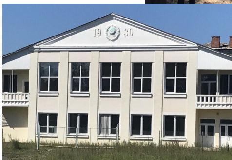
Бывший военный городок