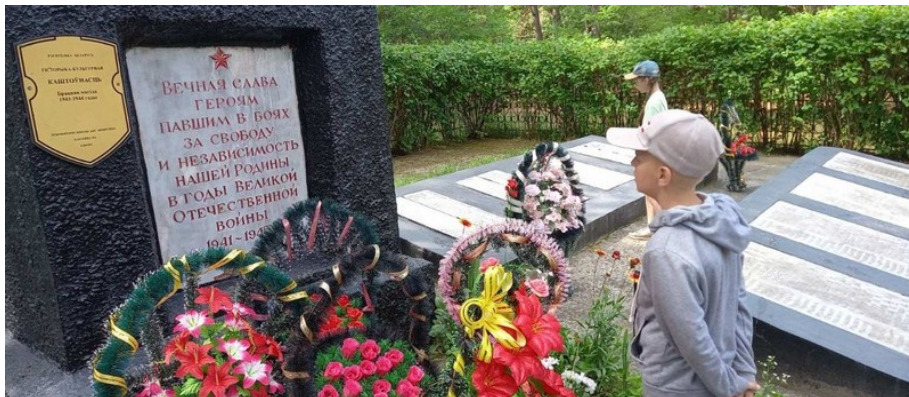
Посещение братской могилы

Большое внимание в лагере уделялось патриотическому, нравственному, эстетическому и экологическому воспитанию.