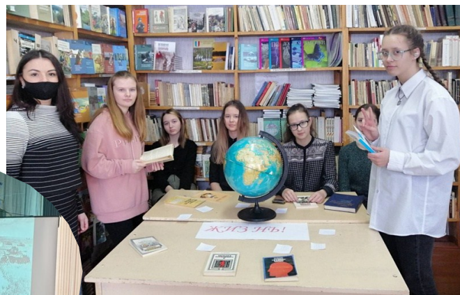
Круглый стол "Ценишь ли ты моменты жизни?"

В рамках недели "Жизнь - это счастье, сотвори его сам" проведены акции, тематические классные часы, диспут "Ценность жизни", круглые столы "Ценишь ли ты моменты жизни?", "Поговорим о девочках", беседы, оформлена выставка тематической литературы, был организован праздник "Рождественская звезда".